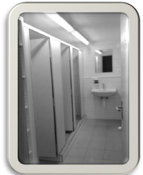
Nasszellen Skihaus Empächli 2013